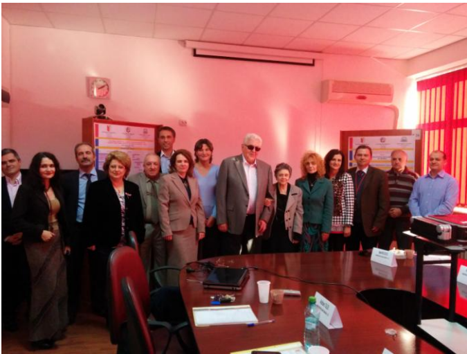
Intalnire membri din cadrul contractului BONY