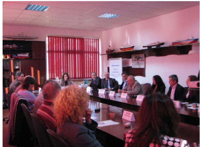
Discutii intre parteneri